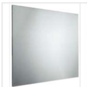
Crédence inox brossé - Photo non contractuelle